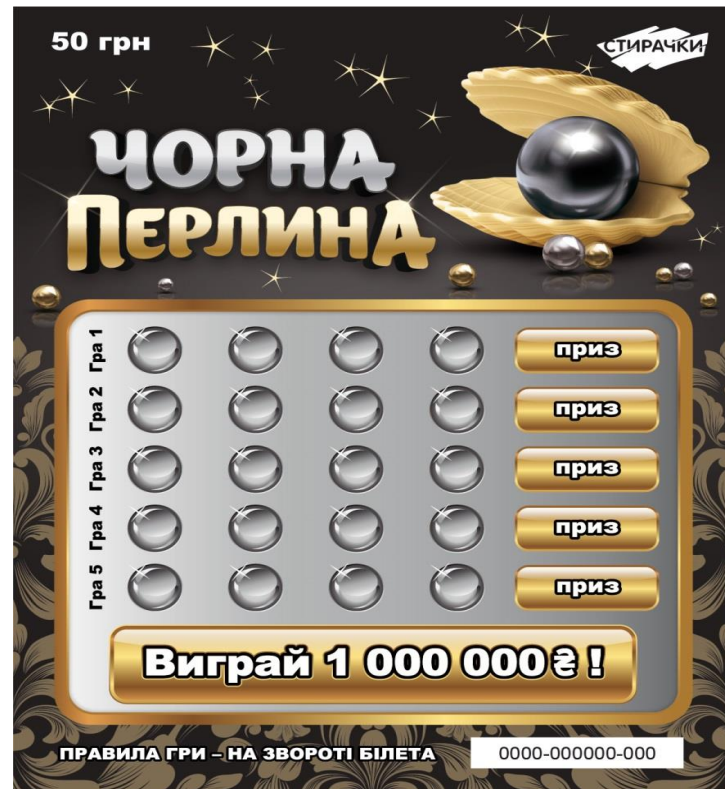
Лицьова сторона лотерейного білета