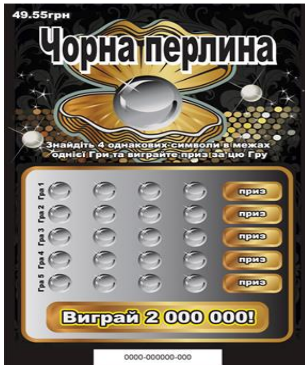
Лицьова сторона лотерейного білета